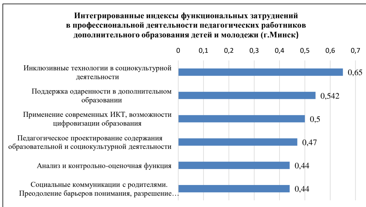
Диаграмма 2. Индексы функциональных затруднений.

6. Целевая разработка обучающих программ профессионального развития педагогических кадров, направленная на преодоление выявленных профессиональных затруднений, позволит нивелировать недостаточность актуальных социально-профессиональных компетенций, повысить конкурентоспособность национальной белорусской модели дополнительного образования детей и молодежи и ее эффективность в межстрановых партнерских социокультурных и профессиональных коммуникациях.