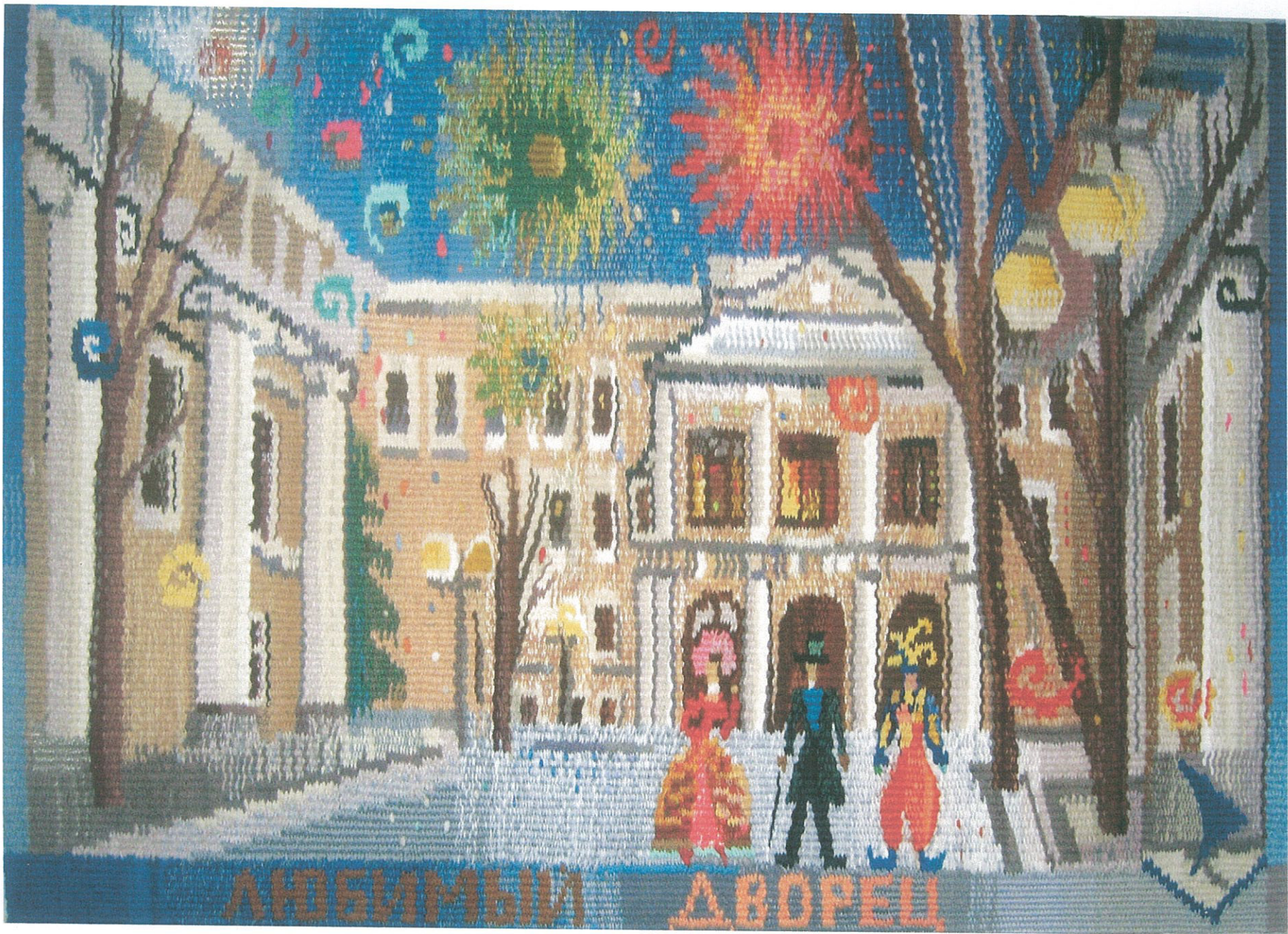
Коллективная работа "Любимый дворец" ручное ткачество, педагог Бушуева Г.Б.