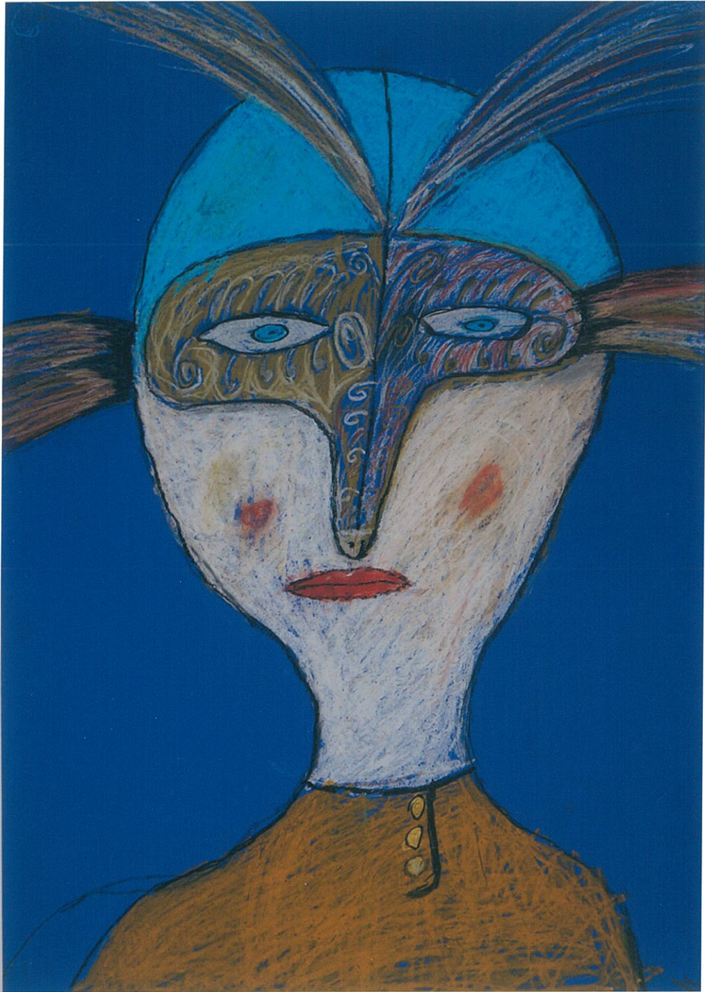
Дебижев Саша, 7 лет «Маска», масл. пастель педагог Гросу В.