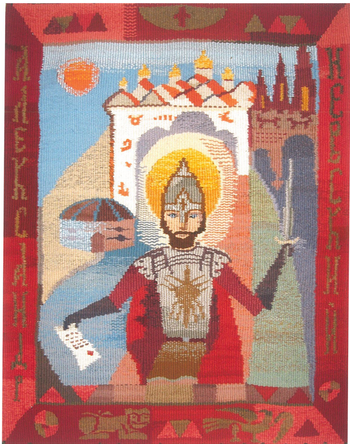
коллективная работа «Александр Невский», ручное ткачество педагог Бушуева Г.Б..