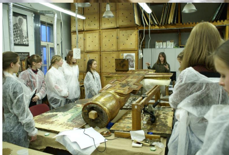
Фото с мастер-класса в Академии Художеств, 2017 год