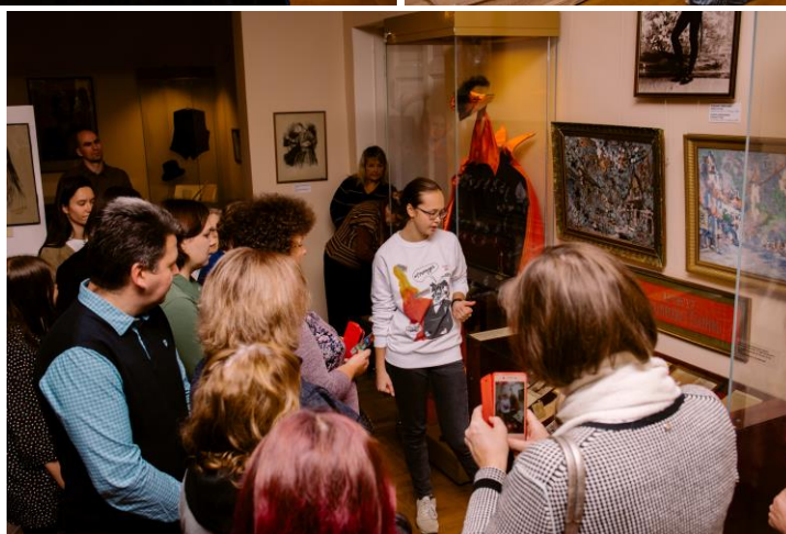
Фото с проекта. На фото учащиеся ИКК «Петрополь»