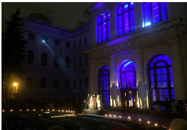
Фото с акции “Свеча памяти”, 2018 год