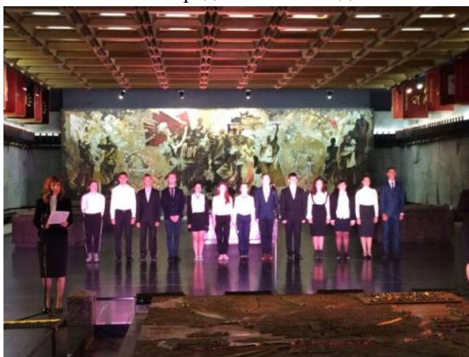
На фото участники акции «Вспомнить всех поименно»