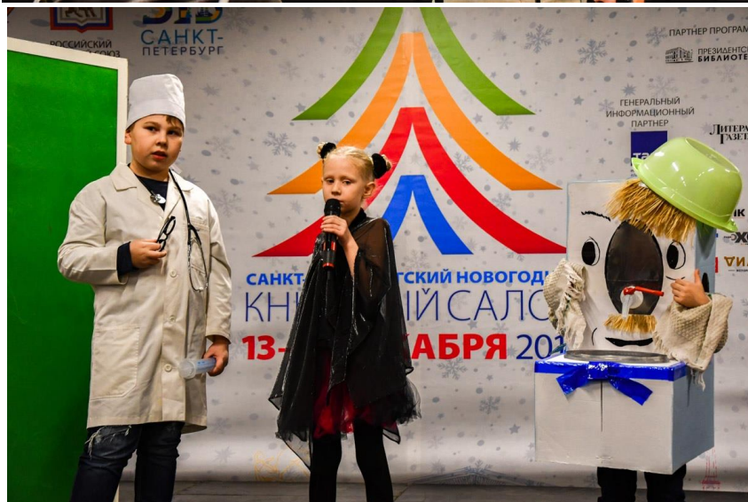
Фото с выступления учащихся ИКК «Петрополь» на Санкт-Петербургском новогоднем книжном салоне