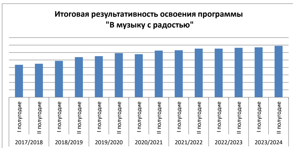
Рис. 1 Результаты, подтверждающие наличие положительной динамики.

В конце каждого учебного года результаты освоения учащимися программы отражаются в информационных диагностических материалах, которые специально разработаны для фиксации предметных, метапредметных и личностных результатов учащихся. По результатам анализа диагностических материалов обучающихся по программе за полный цикл реализации (2017-2024 г.г.) были получены результаты, подтверждающие наличие положительной динамики (Рис.1).