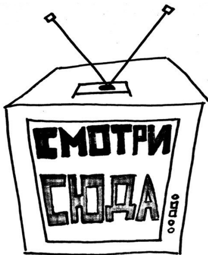
Рисунок Анастасии Сергеевой

объясняя свой выбор желанием узнать больше нового о привычных вещах и явлениях.